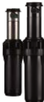
I-25-04 Altura total: 20 cm Altura de emergencia: 10 cm Diámetro expuesto: 5 cm Conexión: 1" BSP