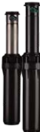
I-25-06 Altura total: 26 cm Altura de emergencia: 15 cm Diámetro expuesto: 5 cm Conexión: 1" BSP